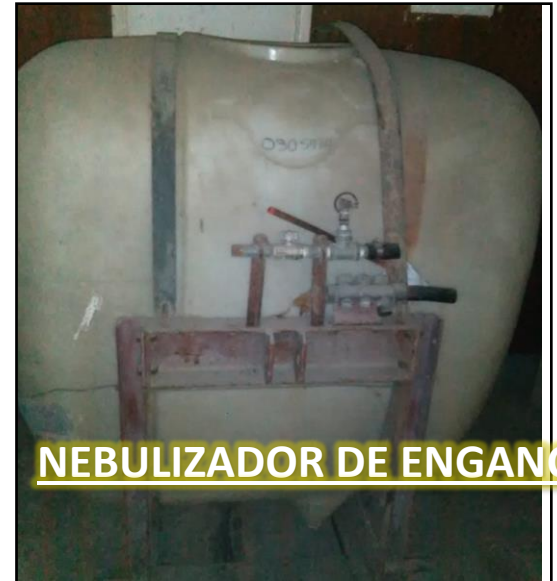
NEBULIZADOR DE ENGANCHE