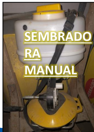
SEMBRADO RA MANUAL