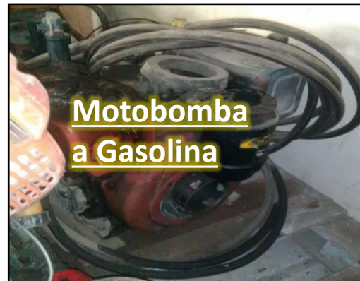
Motobomba a Gasolina