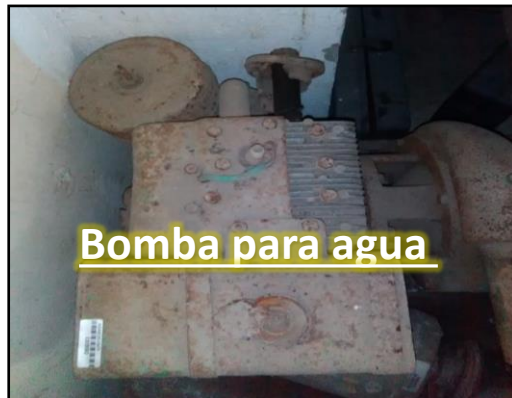
Bomba para agua